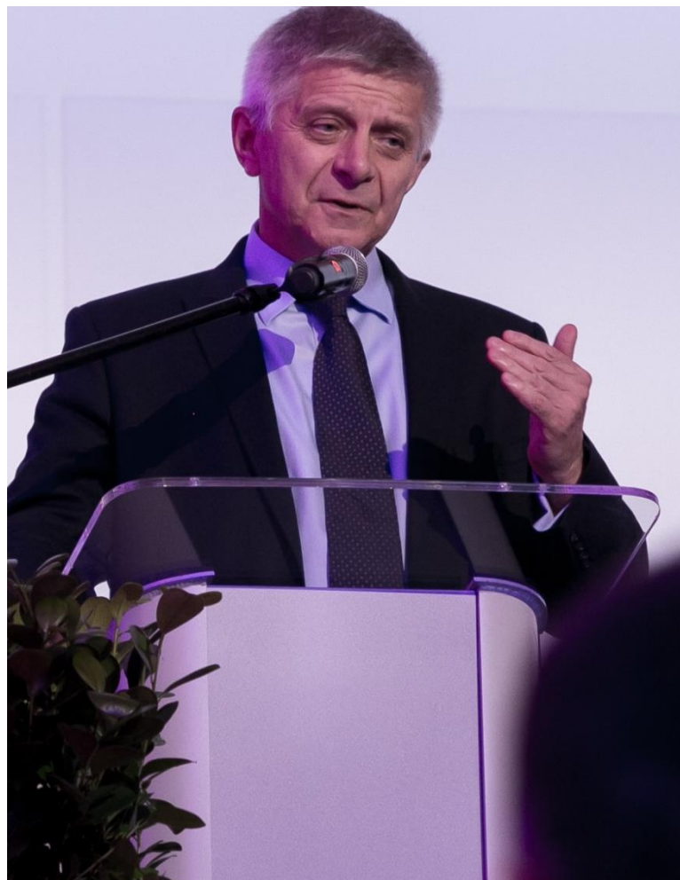
prof. Marek Belka