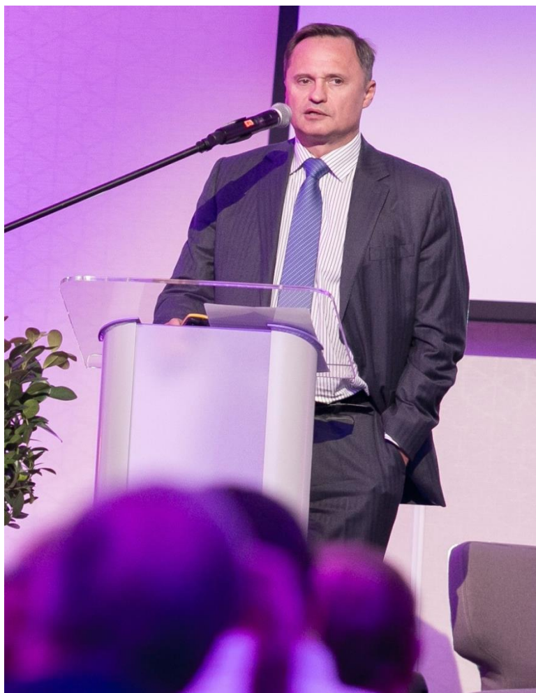
dr Leszek Czarnecki